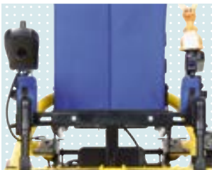
• Teleskopierbare Seitenteile