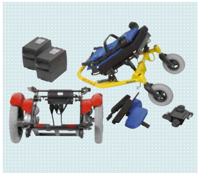
• Schnell zerlegbar und dadurch leicht zu verstauen und transportabel