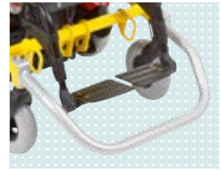
• Rammschutzbügel, abnehmbar (nur bis UL 320 mm)