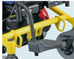
• Fahrzeugtransportsatz für BTW-Transport