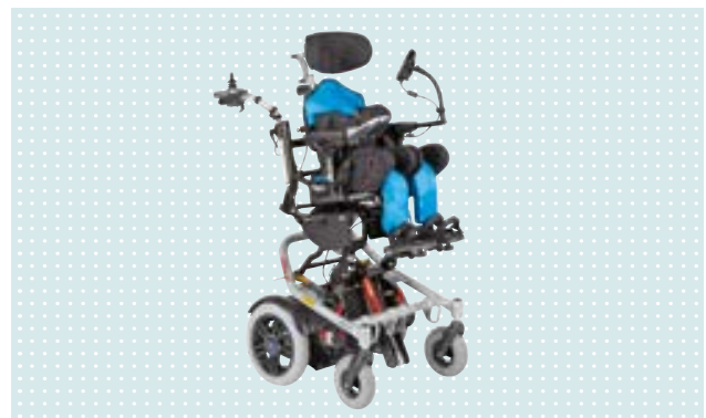
• Skippi Plus Elektrorollstuhl mit Mygo Sitzsystem (optional)