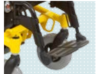
• Beinstütze, geteilt