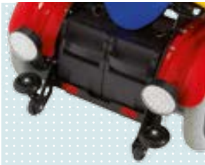
• LED-Beleuchtung nach StVZO