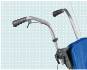
• Schiebegriffe höhenverstellbar, abnehmbar