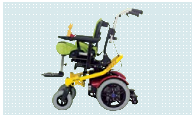
• Elektrorollstuhl Skippi mit Squiggles Sitzsystem (optional)