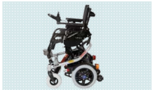
• Skippi Plus mit elektrischer Sitzkantelung und maximaler Sitzhöhenverstellung