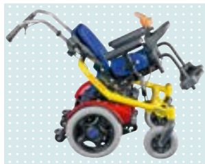
• Elektrische Sitzkantelung