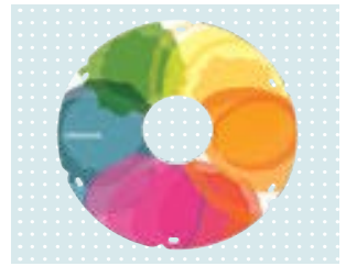
• Speichenschutz „Spectrum“