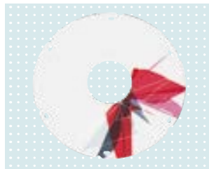
• Speichenschutz „Network“