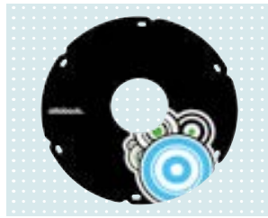
• Speichenschutz „Graphics“