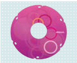
• Speichenschutz „Miracle“