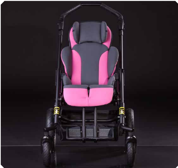
Kompakt. Leicht. Sportlich.

Coole Optik. HOGGI-Laserschriftzug in den Seitenblenden.