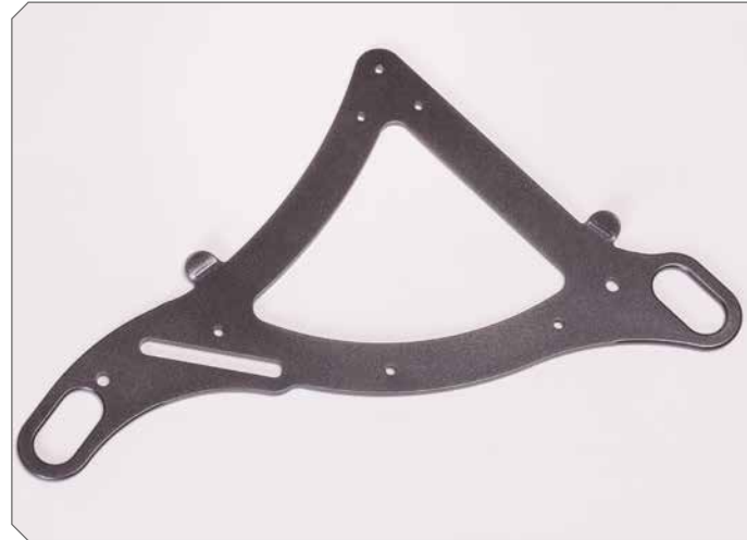
Sitzlagerplatte mit Zurröse.