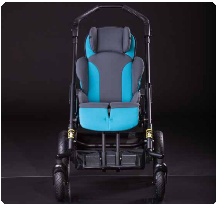
Kompakt. Leicht. Sportlich.

Cooler Optik. HOGGI-Laserschriftzug in den Seitenblenden.