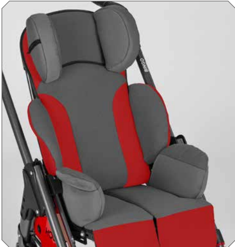
- Kopfstützpelotten (hohe Version). - Seitenpelotten.