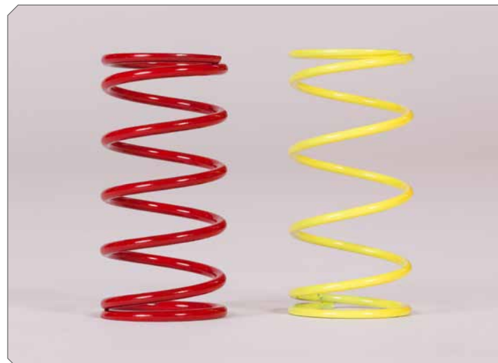
Federsätze in verschiedenen Stärken.