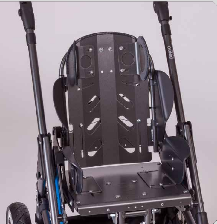
Viele individuelle Einstellmöglichkeiten.

Die multifunktionale Sitzeinheit bietet dir mit einer Vielzahl von verschiedenen Pelotten individuelle Einstellmöglichkeiten für dein Kind.