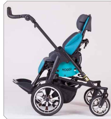
Sitzeinheit gegen Fahrtrichtung.