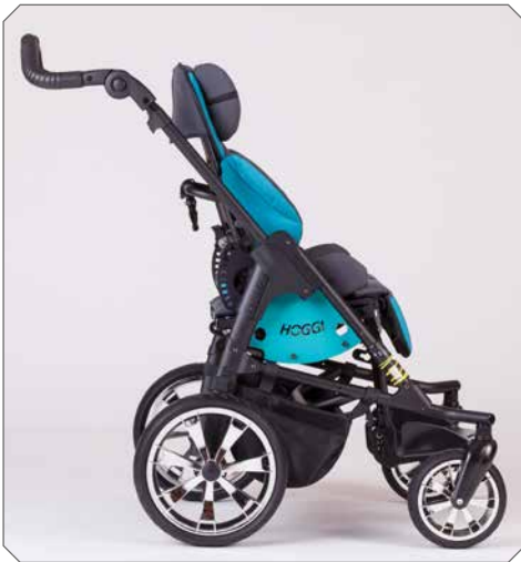
Sitzeinheit in Fahrtrichtung.