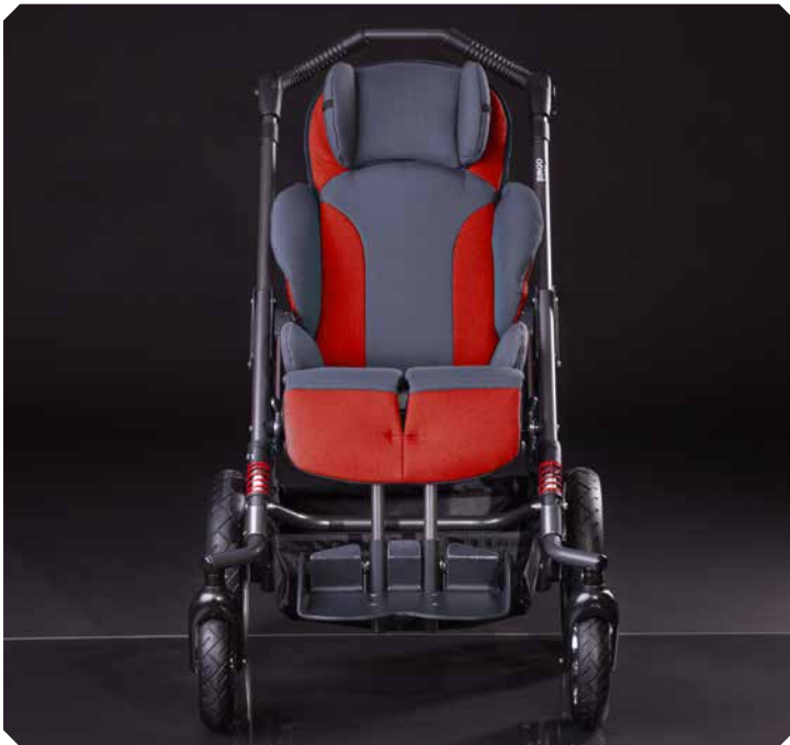
Kompakt. Leicht. Sportlich.