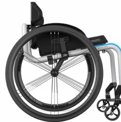
CLOSED ANGLE FRAME