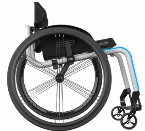
OPEN ANGLE FRAME